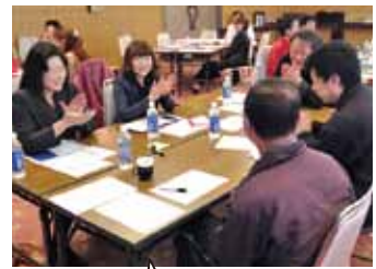
3月に八戸ユートリーで実施された、社員研修です

青森県三八上北地域に軸足を据え、グローバルに発信する企業です。 “ものづくりジャパン”の一員として 夢と誇りを持てる方を期待いたします。